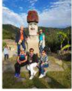
Chile y la Ruta de los Vinos