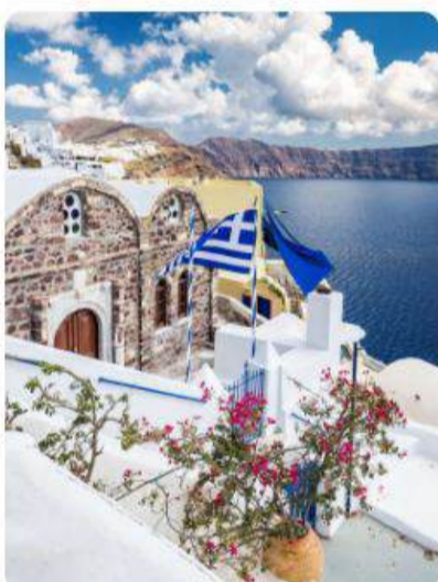
Crucero de Lujo por las Islas Griegas