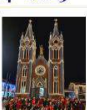
Boyacá y Alumbrados Navideños