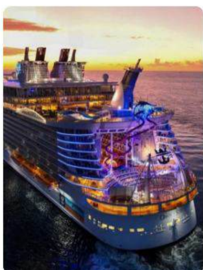
Crucero de Lujo por las Bahamas