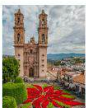
México Colonial y la Ruta del Mariachi