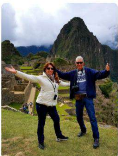
Perú y Machu Picchu