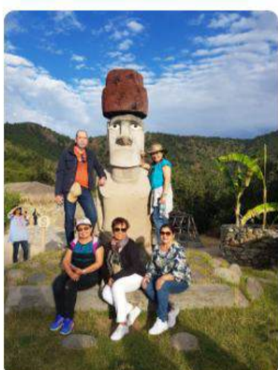
Chile y la Ruta de los Vinos