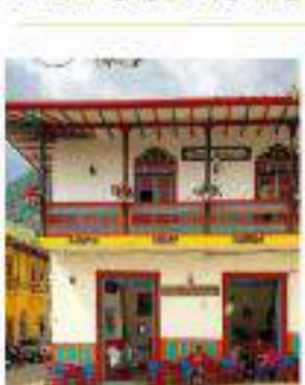
Medellín y Pueblos de Antioquia