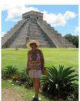
Cancún y la Ruta Maya