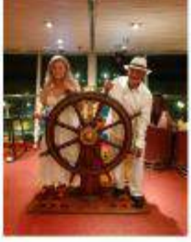
Crucero por el Caribe