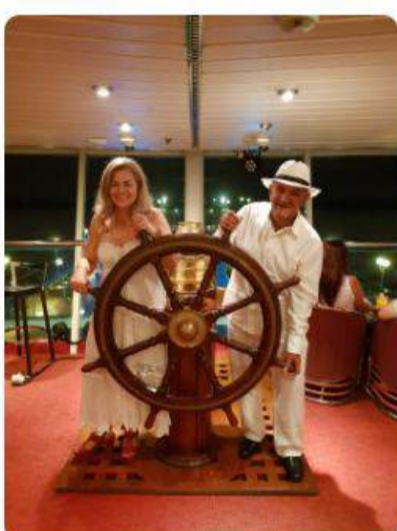
Crucero por el Caribe