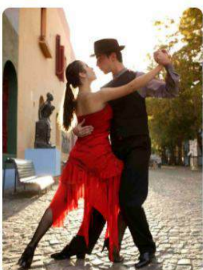
Argentina y la Ruta del Tango