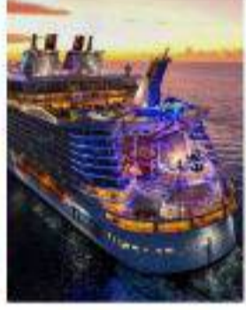
Crucero de Lujo por las Bahamas