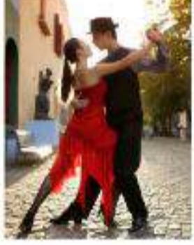
Argentina y la Ruta del Tango