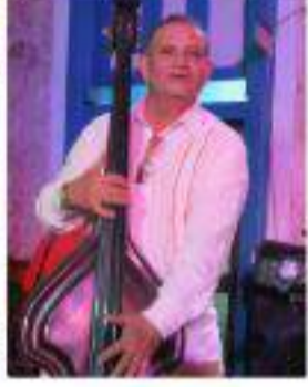
Cuba y la Ruta Musical