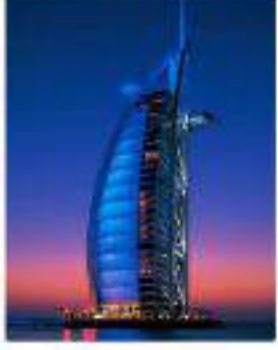
Turquía y Dubái