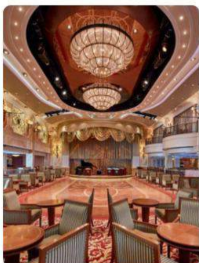
Crucero por los Emiratos Árabes