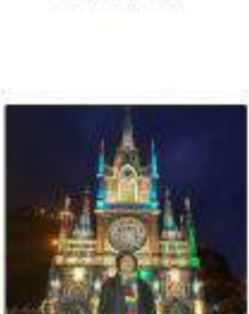
Nariño y Santuario de las Lajas