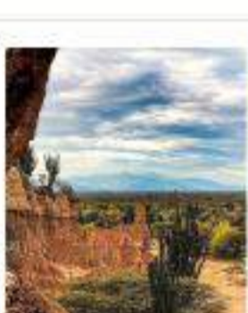
Desierto de la Tatacoa y Huila