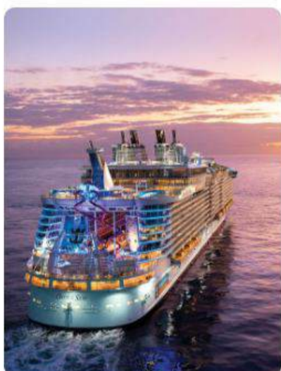
Crucero por el Caribe Mexicano