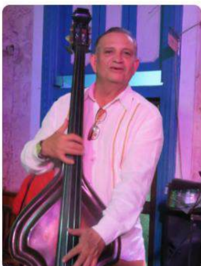
Cuba y la Ruta Musical