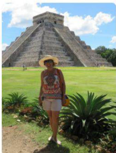
Cancún y la Ruta Maya