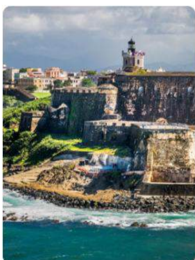
Puerto Rico y la Ruta de la Salsa