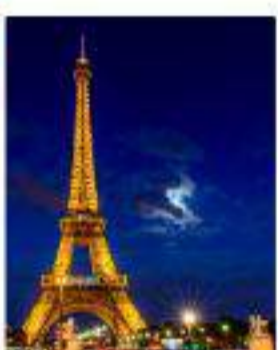
Europa de Lujo: Francia, Italia y España