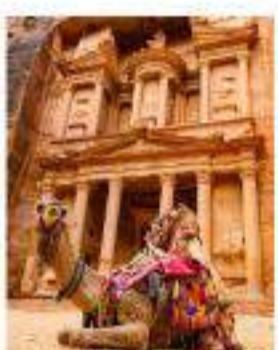
Egipto, Jordania y Tierra Santa