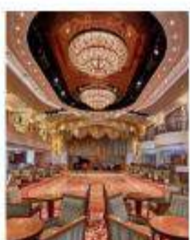
Crucero por los Emiratos Arabes