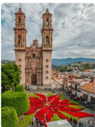
México Colonial y la Ruta del Mariachi