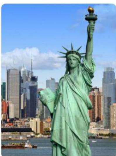
Lo mejor de Estados Unidos