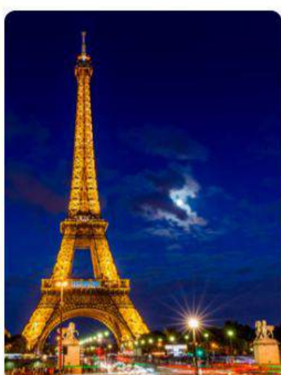
Europa de Lujo: Francia, Italia y España