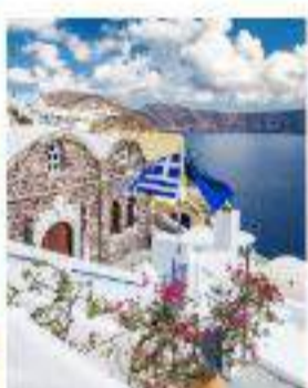
Crucero de Lujo por las Islas Griegas