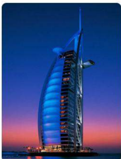
Turquía y Dubai